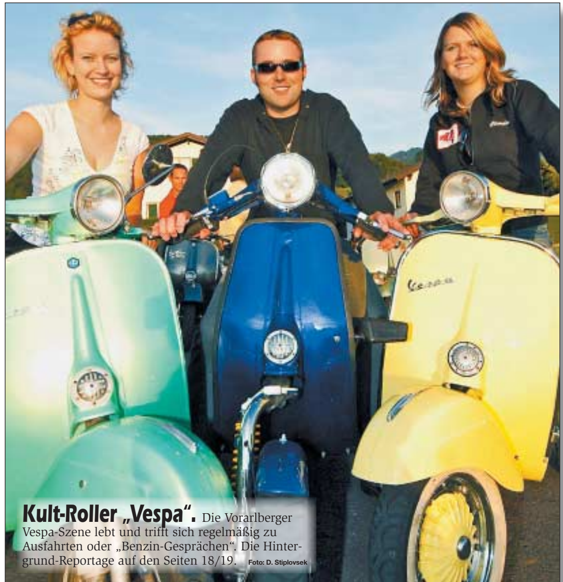
Kult-Roller „Vespa“. Die Vorarlberger Vespa-Szene lebt und trifft sich regelmäßig zu Ausfahrten oder „Benzin-Gesprächen“. Die Hintergrund-Reportage auf den Seiten 18/19.

Formel-1 . Felipe Massa fuhr gestern vor Michael Schumacher die erste Pole seiner F1-Karriere heraus. Klien startet aus der 5. Reihe. (Seite 25)